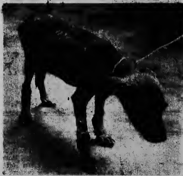
Het hondje van het artikel ...

ORANJESTAD. — Wij vinden het altijd fijn, wanneer wij ontdekken, dat er tussen die vele mensen, die geen hart voor de dieren - evenals de mens ook door God geschapen - hebben en die in hun dure wagens zitten graag even een extra rukje aan het stuur geven om een klein geitje vooral niet te missen en die hun jonge hondjes en katjes meestal gewoon in de koekoek of op straat en soms in de tuin van mensen, van wie zij weten, dat zij een warm hart voor dieren hebben „verloren zetten” - wij vinden het steeds weer een rijke ervaring wanneer wij tussen al deze heden en kelingen ontdekken, die goed voor de dieren zijn en hen met zorg omringen.